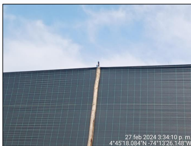
Ilustración 2. Aspersores de agua en el cerramiento del predio

La visita fue atendida por la profesional de certificaciones y el ingeniero MIPE MIRFE de la empresa Flores de los Andes, los cuales manifestaron que el riego a la vía se realiza a través de aspersores (ilustración 2), teniendo en cuenta que por las condiciones actuales de la vía al no encontrarse pavimentada y el alto flujo vehicular, el material particulado afecta la producción de la flor, por lo tanto la empresa ha realizado varias acciones: en primer lugar la siembra de una cerca viva, segundo lugar extensión de polisombra y tercer lugar instalación de aspersores, los cuales se encienden una vez al día en tiempo seco.