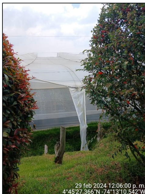
Ilustración 2. Captación y conducción aguas lluvias